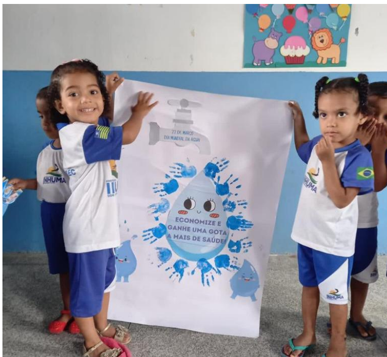
23/03/2023 – PRODUÇÃO DE CARTAZ