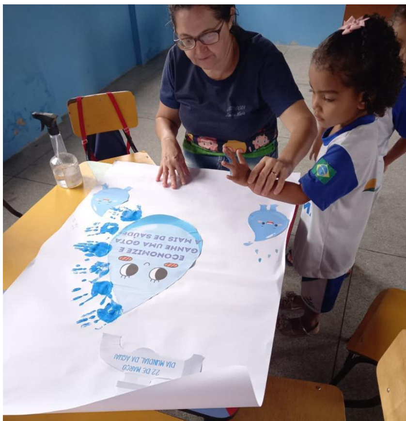
23/03/2023 – PRODUÇÃO DE CARTAZ