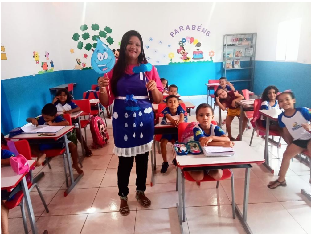
23/03/2023 – CONTAÇÃO DE HISTÓRIA (A GOTINHA PLIM PLIM)