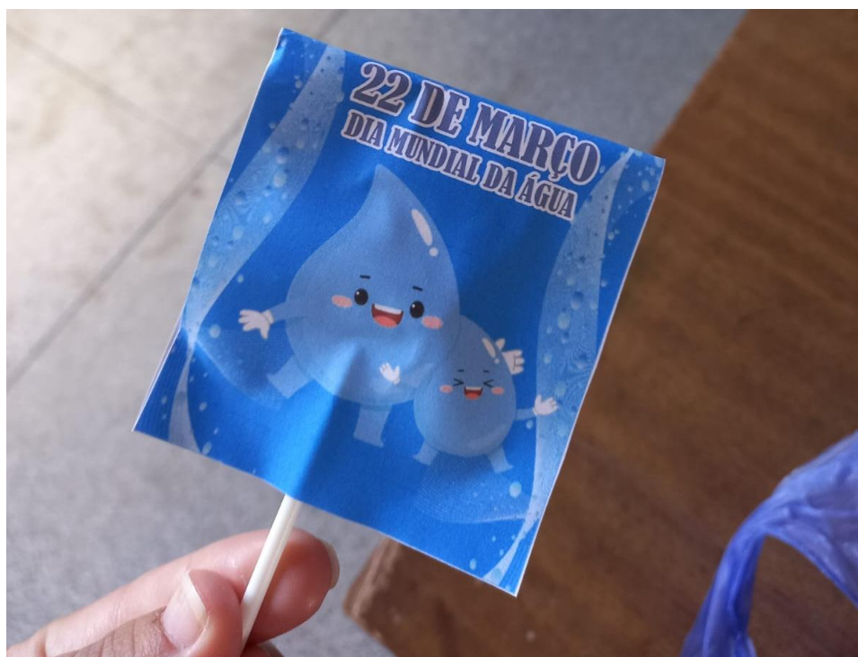
24/03/2023 – PRODUÇÃO DE LEMBRANCINHA