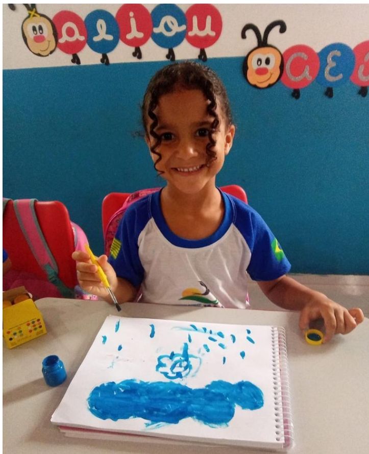
23/03/2023 – PINTURA