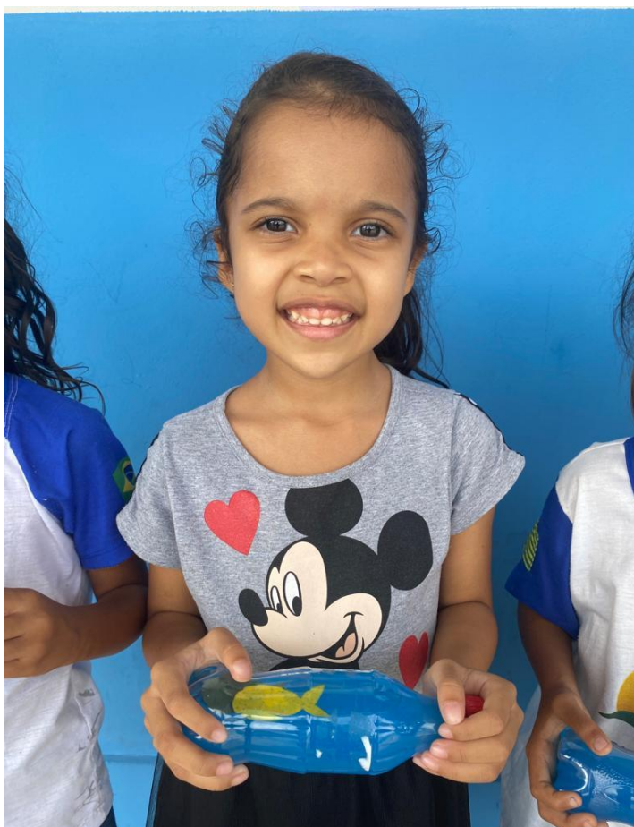
24/03/2023 – CONFEÇÃO DE UM AQUÁRIO