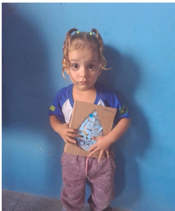
24/03/2023 – RECORTE E COLAGEM