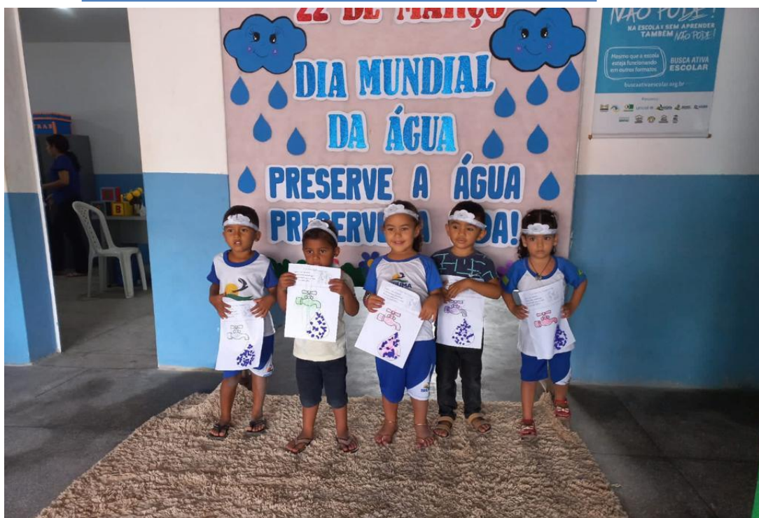
24/03/2023 – RECORTE E COLAGEM