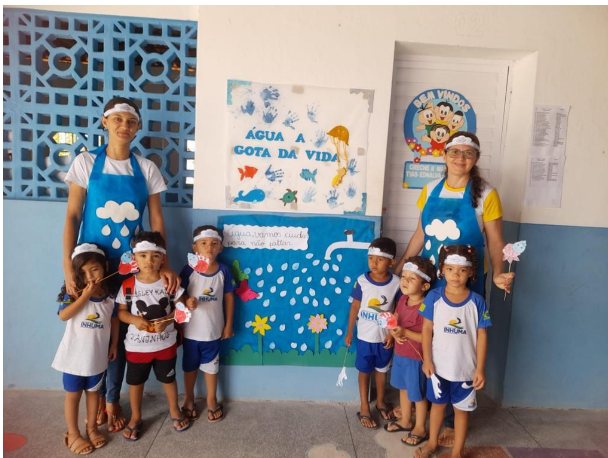
23/03/2023 – PRODUÇÃO DE CARTAZ