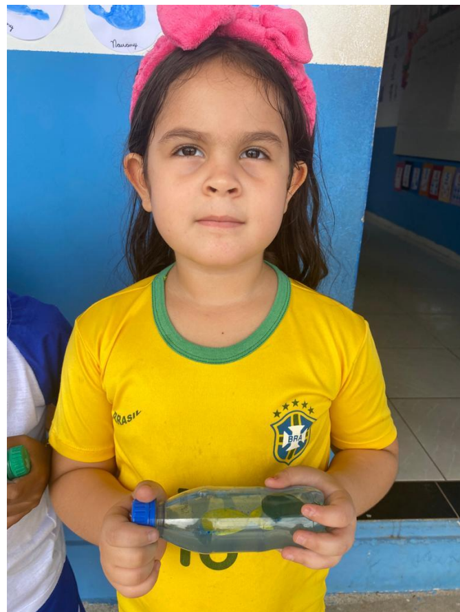
24/03/2023 – CONFEÇÃO DE UM AQUÁRIO