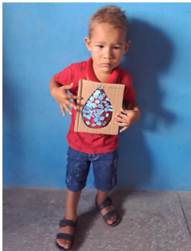
24/03/2023 – RECORTE E COLAGEM