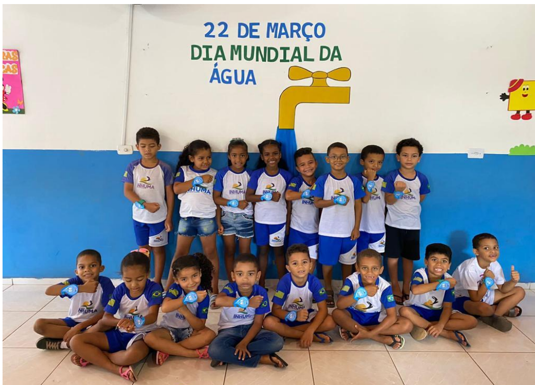
24/03/2023 – PRODUÇÃO DE UM RELÓGIO