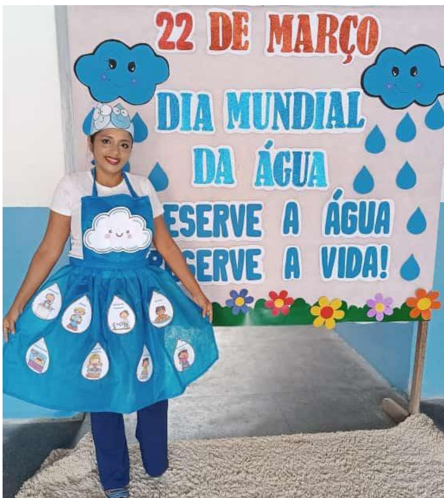
23/03/2023 – CONTAÇÃO DE HISTÓRIA