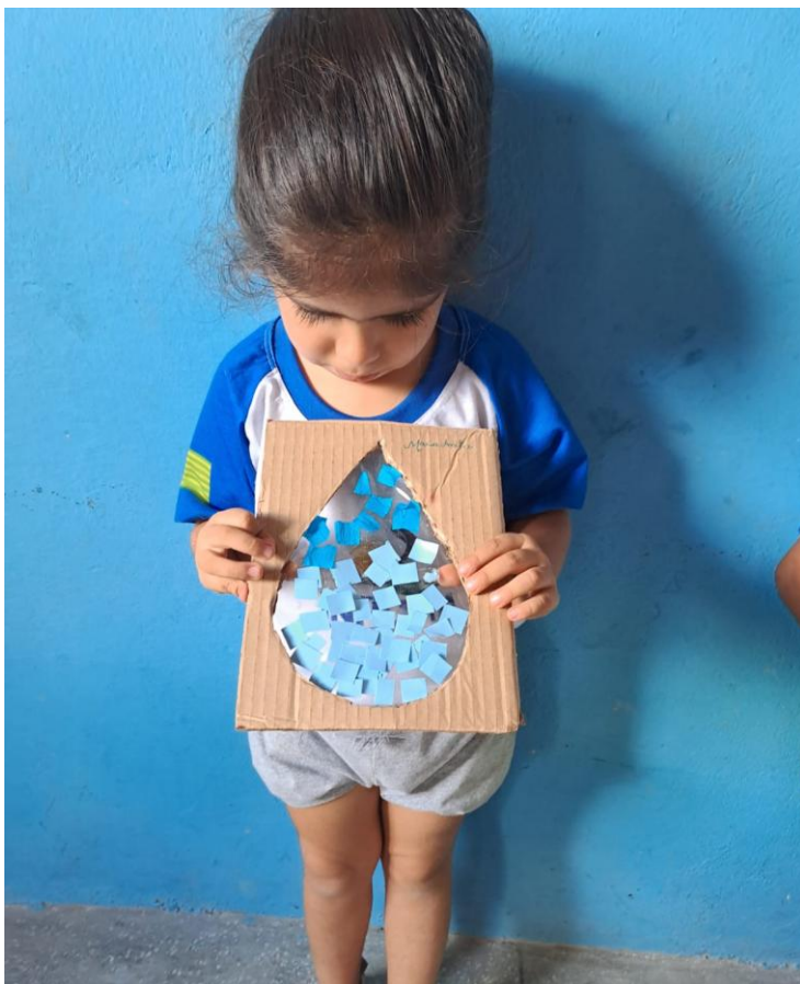
24/03/2023 – RECORTE E COLAGEM