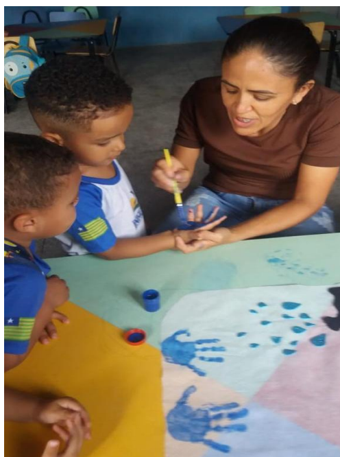
23/03/2023 – PINTURA